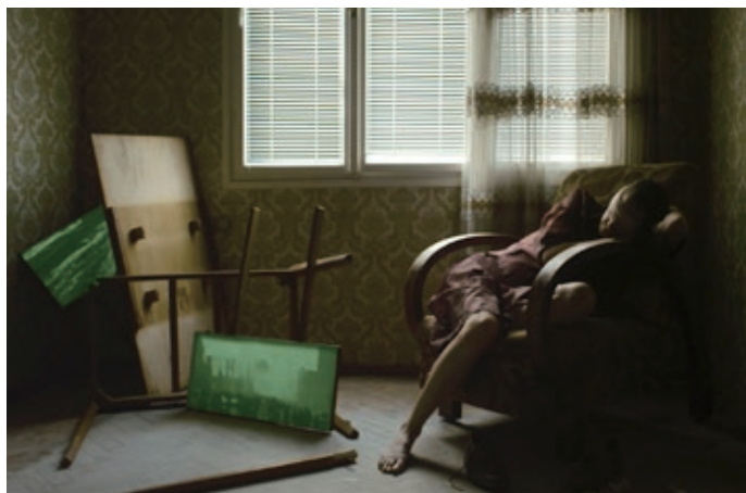
Installation Film «Baba Vanga»

会期：2016年11月26日（土）－12月3日（土）11:00 - 19:00（11月28日（月）は休館） ※開館中いつでもご覧いただけます。 | 料金：無料