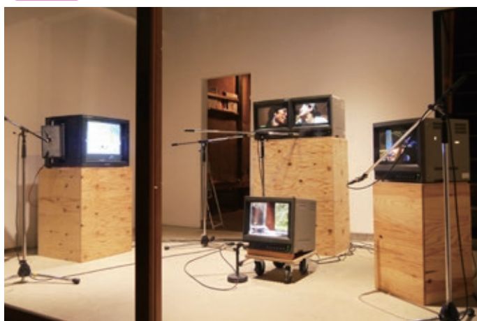
《男と女のエコー》2015 © 東山アーティストプレースメントサービス (HAPS) (参考画像)