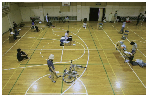
実験音楽とシアターのためのアンサンブル ジョン・ケージ(ヴァリエーションズ) パフォーマンス 風景, 2009, 旧四谷第三小学校体育館 ©Yotsuya Art Studium