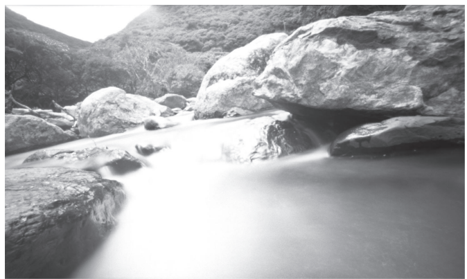
足利 広 (vision for kalpa) 2011, HD 映像(2分)