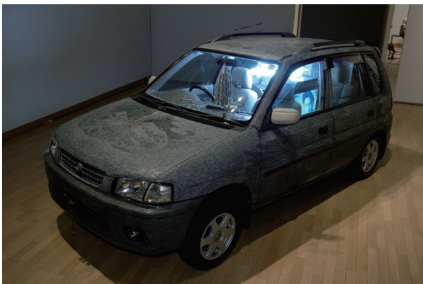
チームやめよう (「お金」やめよう) 2011 「第14回岡本太郎現代芸術賞」展示風景, 川崎市岡本太郎美術館, 神奈川