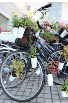
《「違法駐車」やめよう》2009 「ゲンビどこでも企画公募2009」インスタレーション風景 広島市現代美術館、広島