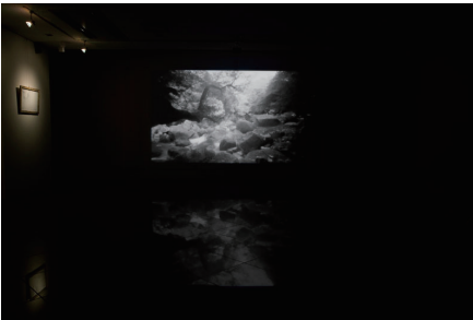
個展「空白と社」展示風景、2011、瑞聖寺アートプロジェクト、東京