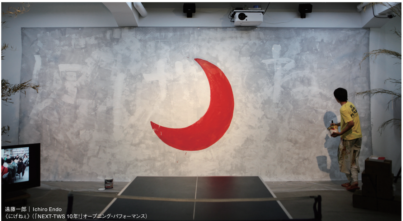
遠藤一郎 | Ichiro Endo 《にげねえ》(「NEXT-TWS 10年!」オープニング・パフォーマンス)