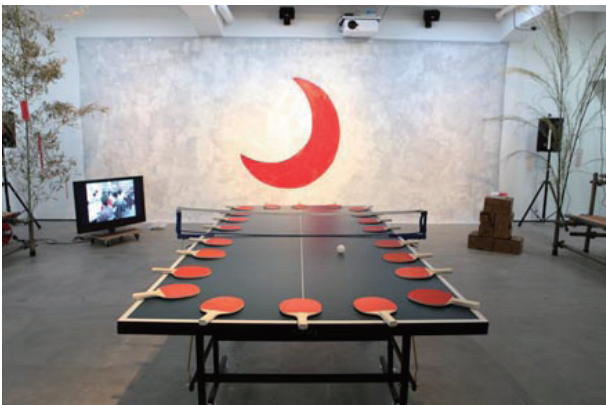
STUDIO NEXT-10! 奥：遠藤一郎 | Back: Ichiro Endo