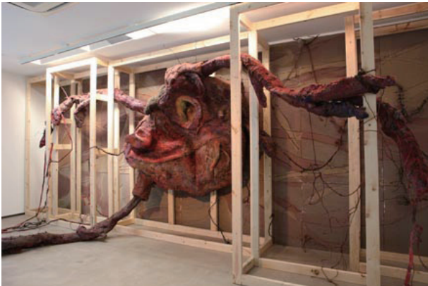
オル太 | OLTA 《羊の心臓》2011