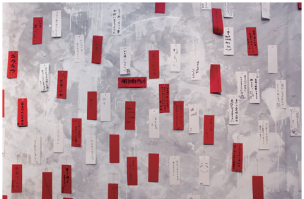
7月7日七夕のオープンに合わせて来訪者の願い事を展示 | Visitor's wishes dedicated to the Star Festival on July 7 (opening day)