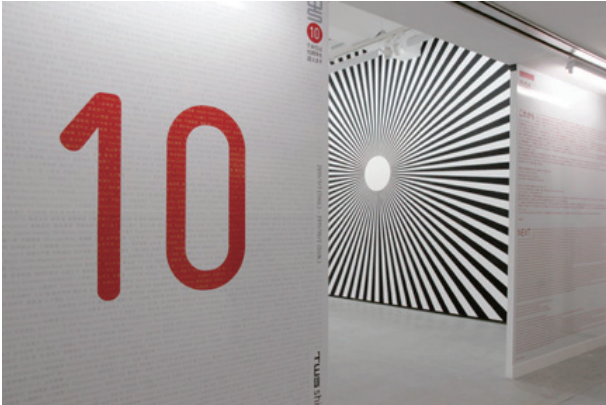
エントランス | Entrance 奥：寺澤伸彦 | Back: Nobuhiko Terasawa 《いつまでも未完なこの世界で考えたこと》2011