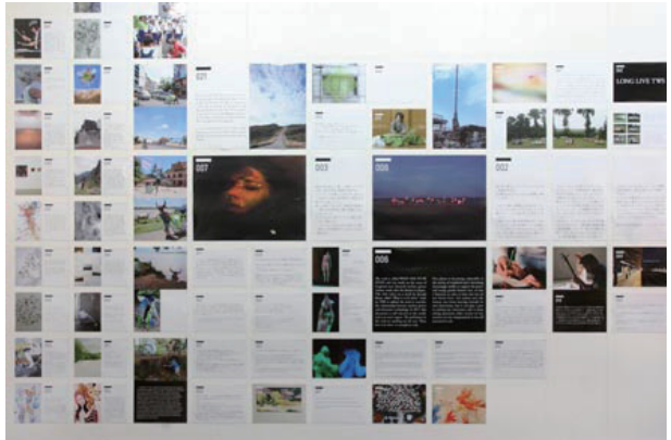
TWS 関係クリエイターからのメッセージ | Messages from TWS Related Creators