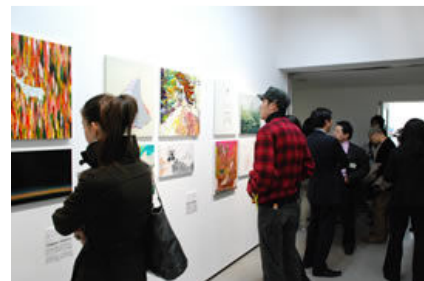
写真/左・右：ワンダーシード2008 展示風景/中央：ワンダーシード2008 入選作品