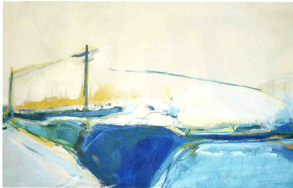
石本かや乃 《いえのまえ》 2005 油彩・綿布