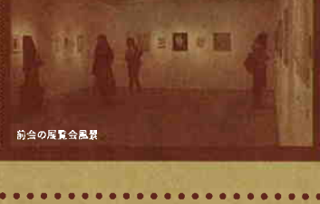
前回の展覧会風景