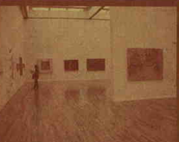
「トーキョーワンダーウォール公募 2005」入選作品展 (東京都現代美術館)