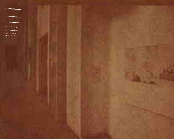
「トーキョーワンダーウォール都庁 2005」展示風景 (東京都庁第一本庁舎3階南側空中歩廊)

問い合わせ先 東京都生活文化局文化振興部活動支援課 TEL:03-5388-3067