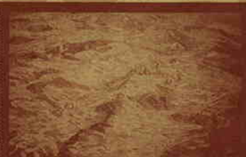
久保 風 (Seap Bloom-Uruguay)