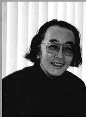
一柳慧 (作曲家、ピアニスト) Toshi Ichiyanagi (Composer, Pianist)

作曲家・ピアニスト。神戸生まれ。10代に二度毎日音楽コンクール(現日本音楽コンクール)作曲部門で第一位受賞。19歳で渡米、ニューヨークでジョン・ケージらと実験的音楽活動を展開し、61年に帰国。偶然性の導入や図形楽譜を用いた作品で、さまざまな分野に強い刺激を与える。これまでにベルリン・フェスティバル、ケルン音楽祭、オランダ・フェスティバル、ウィーン・モダン音楽祭、オスロ・ウルティマ・フェスティバルなどから招聘され、委嘱作品と日本の現代作品を上演。賞はニューヨークでエリザベス・クーリッジ賞(55年)、アレキサンダー・グレチャニノフ賞(58年)、パークシェア音楽祭でセルゲイ・クーセヴィツキー賞(57年)、フランスで文