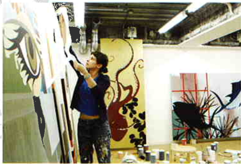
《Transition In Space》(部分/Detail) | 1998