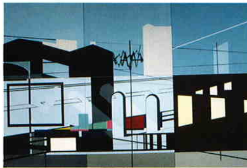
《Yellow Fever》(展示風景/Installation View) | 2003