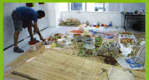
ボスコ・ソーディ、滞制作風景 | Bosco Sodi working in his studio