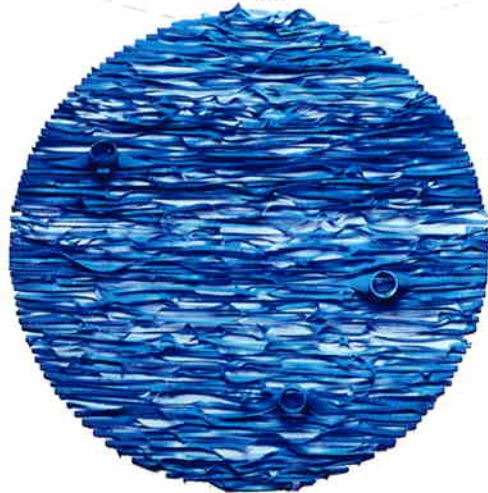
《Marine no.12》 | 2001 ペットボトル / Plastic Bottle