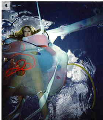
①Lacrimacorpus (Zeitschneide), 2004 ②Lacrimacorpus (Goethe Park), 2004 ③Blood, Sea-Volva Volva, 2004 ④Blood, Sea-Volva, 2004