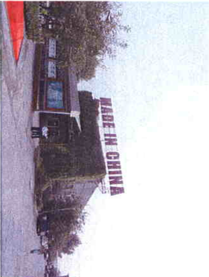
Arario Gallery Beijing

tokyo wonder site Institute of Contemporary Art and International Cultural Exchange, Tokyo