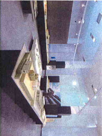
Iam, Jun The 2nd Architectural Biennale Beijing China National Museum