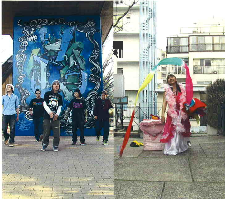
迷樓 -- 東京 Mi-Lou -- Tokyo | interactive video installation 2008

主催:財団法人東京都歴史文化財団 トーキョーワンダーサイト 協力:台北国際芸術村、台北駐日経済文化代表處、日本ビクター株式会社 撮影協力:アキラ、荒木巴、ORIENTARHYTHM、グレゴの音楽一座、ジャズボイラーズ、Joint a Mood、Jonica、ダボ・ダビ・カインソラ、Tokyo Creatist、東京口カビリークラブ、葉芳、伊藤アツ志、今井龍一、HIBI★Chazz-K、MARKAMASIS、ユキンコアキラ、浜崎亮太、河合政之、羅暁青