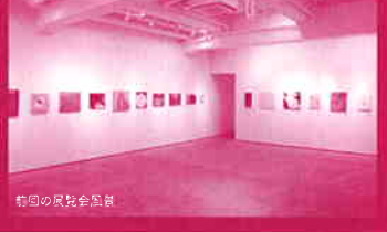
吉岡の展覧会風景