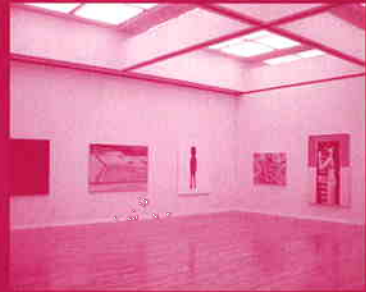
「トーキョーワンダーウォール公募2006」入選作品展 (東京都現代美術館)