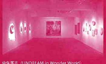
中矢篤志 (UNDREAM in Wonder World)