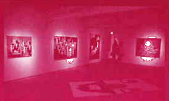
マギー (THIS IS MORE)