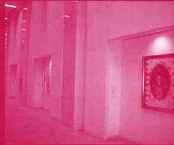
「トーキョーワンダーウォール都庁2006」展示風景 (東京都庁第一本庁舎3階南側空中歩廊)

問い合わせ先 東京都生活文化局文化振興部活動支援課 TEL:03-5388-3067