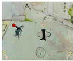
ワンダーシード2007入選作品