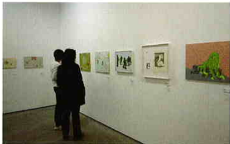
ワンダーシード2007展示風景