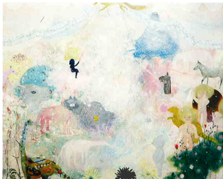
長井朋子 housekibaco 2007 キャンパスに油彩

長井朋子は「私の好きなものを集めて」現実には起こり得ない世界を、魔法をかけるようにキャンパスに描きます。「くまの人も息をし 室内で樹が育ち 森の中で巨大なアイスがとろける」、それは乙女チックな世界?! いえいえ、そこではかわいい女の子の残酷と、いっしょに切り取られたモチーフが、森や部屋の中に思うがまま、わがままに組み合わせた時空の表れとなっています。一方、佐貫巧は日々の生活でどこか気になった形を毎日粘土でスケッチします。それは彼の日記でもあり、2次元の平面に描くというプロセスにより作品ができあがります。どこかにあったような、ないような、夢にとけこむような世界のペインティングは彼のこだわり続ける Powder Blue とともに、普段では届かない心身のどこかをつつみこむように揺さぶり触れるような浮遊世界が立ち現れます。このように本展覧会は、日本の若いアーティストが表す今の感性と空気に触れることのできる機会となっています。