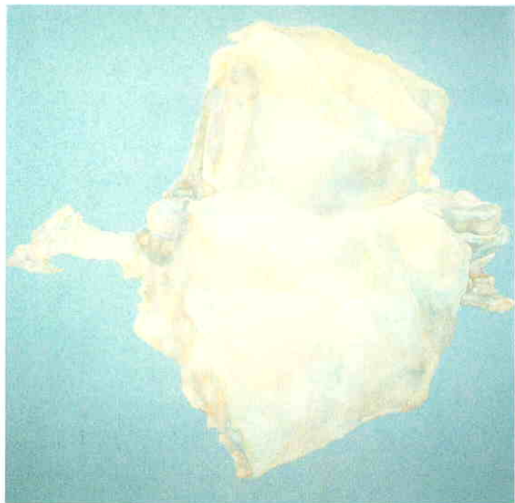
佐貫巧 flow 2006 パネル、アクリル絵具