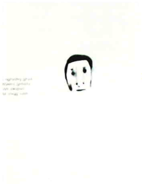
タニケニタ 《untitled(シリーズトsourceより)》 2007 Cプリント