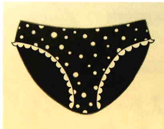
こんどうさちほ 《私のパンツどこ?》 2007 和紙・顔料・墨・ペン