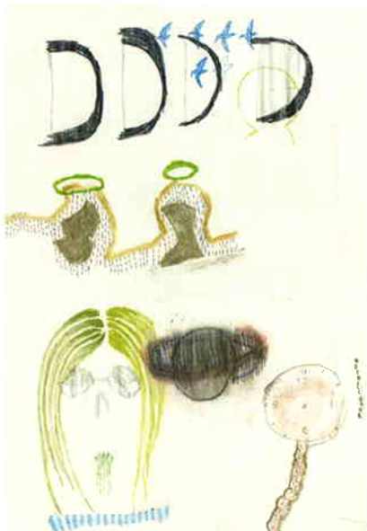
渡邊悠子 《見えないところ》 2005 鉛筆、サインペン、紙、クレパス