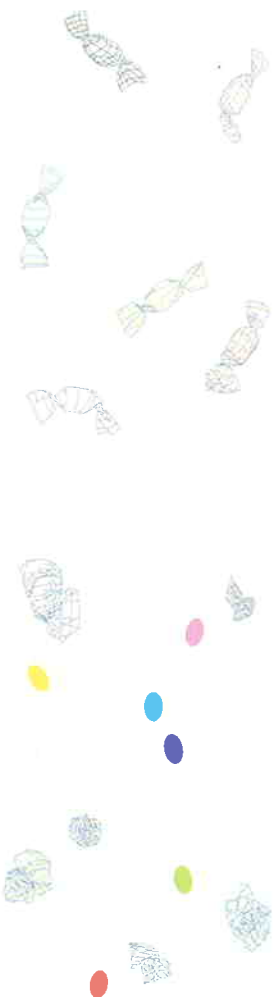
田幡浩一 | untitled, 2005