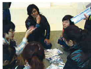
▲「KISEKIの庭」 2007、ミクストメディア 会場: 広沢美術館/ 広島、中国