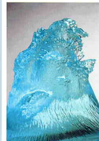
Impression : Sea of Japan 2006