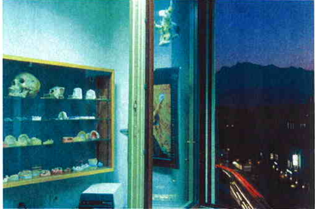
『At the Dentist』(染み名称にて) 2004 『One Hundred Views of Mt. Pilatus』

お車で来館の場合は、近隣の有料駐車場をご利用下さい There is no visitors' parking space, please use the nearby parking lot.