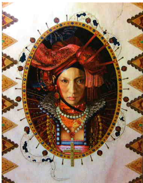
長浜憲二 《ラム・ヴァレンタインと蛇》 2002→2003 油彩・キャンバス