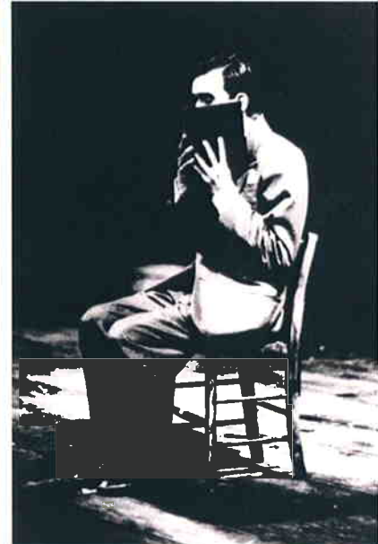
① 世田谷パブリックシアター+コンプリシテ「エレファント・パニッシュ」 ② 世田谷パブリックシアター+コンプリシテ「ストリート・オブ・クロコダイル」

キャサリン・アレクサンダーは、イギリスを代表する劇団コンプリシテ (Complicite) で演出補として、また自身の劇団 Quiconque の監督として活躍している、演出家です。この度、世田谷パブリックシアターで来春上演予定の『谷崎プロジェクト』のために来日し、TWS に滞在します。『谷崎プロジェクト』は世田谷パブリックシアターとコンプリシテが共同で制作する、谷崎潤一郎の小説「春琴抄」を基にした舞台作品です。このプロジェクトでは、身体性に重きをおいた演出術で、世界的に評価されているサイモン・マクバーニーが、日本文化独特の様式美を取り入れ、谷崎が描こうとした人間模様や日本文化の価値観を浮かび上がらせる舞台づくりに取り組みます。7月17日のトークでは、サイモン・マクバーニーの演出補として活躍する、キャサリン・アレクサンダーが、世界各地で上演された2003年発表の『エレファント・パニッシュ』制作時のエピソードや、新作にかかわる意気込みを話す予定です。